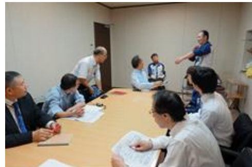
開発部会（実証実験WG）・会議風景