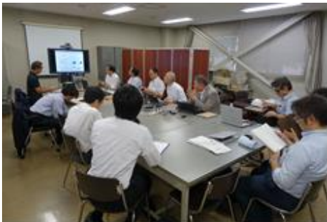
開発部会・会議風景

平成27年度は部会及びWGを合計22回開催し、安全確保システムとして設定した「支援的保護システム」の実際の生産現場における有効性をデータで確認するため、実証実験を行った。